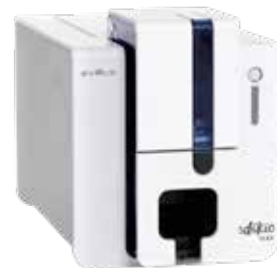
Evolis Edikio Flex

Das mittlere Modell der Reihe bedruckt - ebenfalls einseitig - sowohl Karten im normalen ISO-Format, als auch Karten mit einer Länge von bis zu 150mm für Ihre Auslage oder Theke. Perfekt, wenn Sie flexibel in der Größe der Beschilderung sein möchten. Die Verwaltung der Produktinformationen erfolgt über Produktlisten.