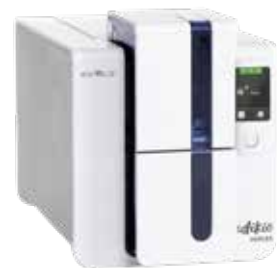
Evolis Edikio Duplex

Das mittlere Modell der Reihe bedruckt - ebenfalls einseitig - sowohl Karten im normalen ISO-Format, als auch Karten mit einer Länge von bis zu 150mm für Ihre Auslage oder Theke. Perfekt, wenn Sie flexibel in der Größe der Beschilderung sein möchten. Die Verwaltung der Produktinformationen erfolgt über Produktlisten.