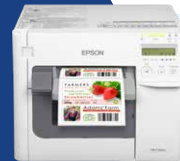
Epson ColorWorks C3500